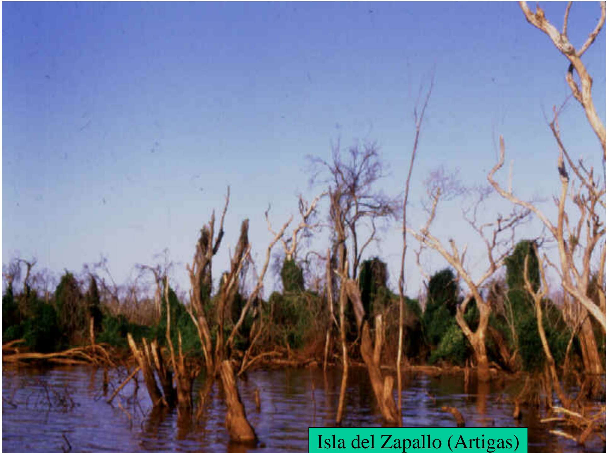
Isla del Zapallo (Artigas)