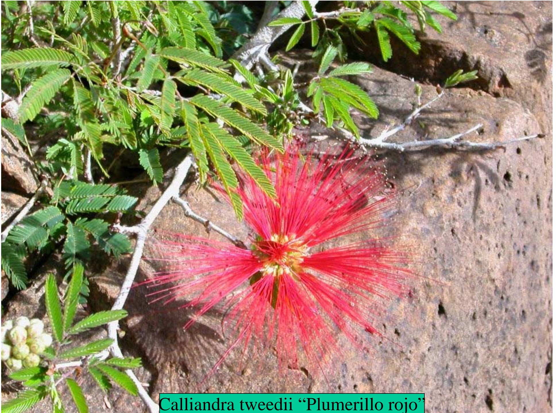
Calliandra tweedii "Plumerillo rojo"