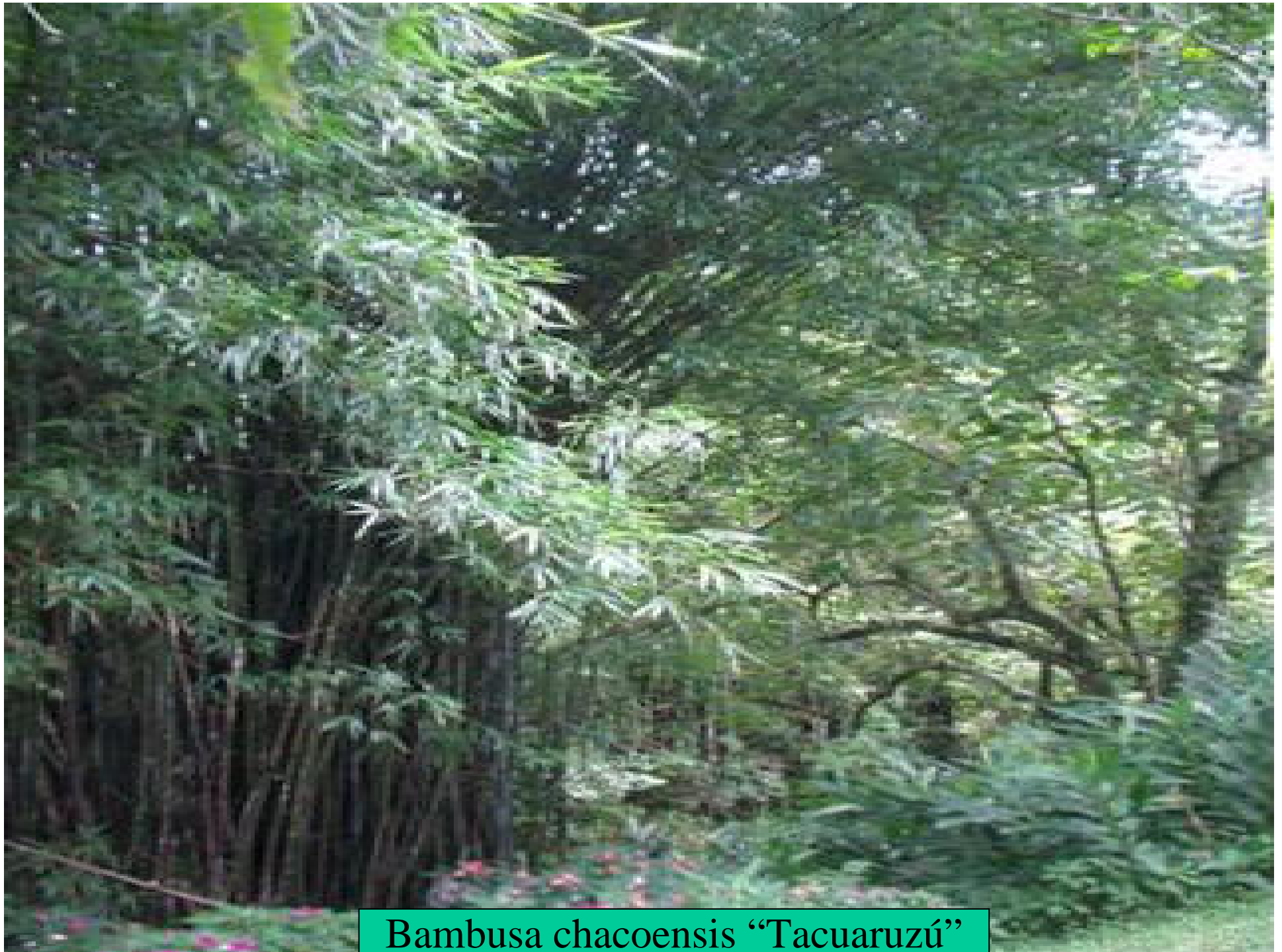
Bambusa chacoensis “Tacuaruzú”