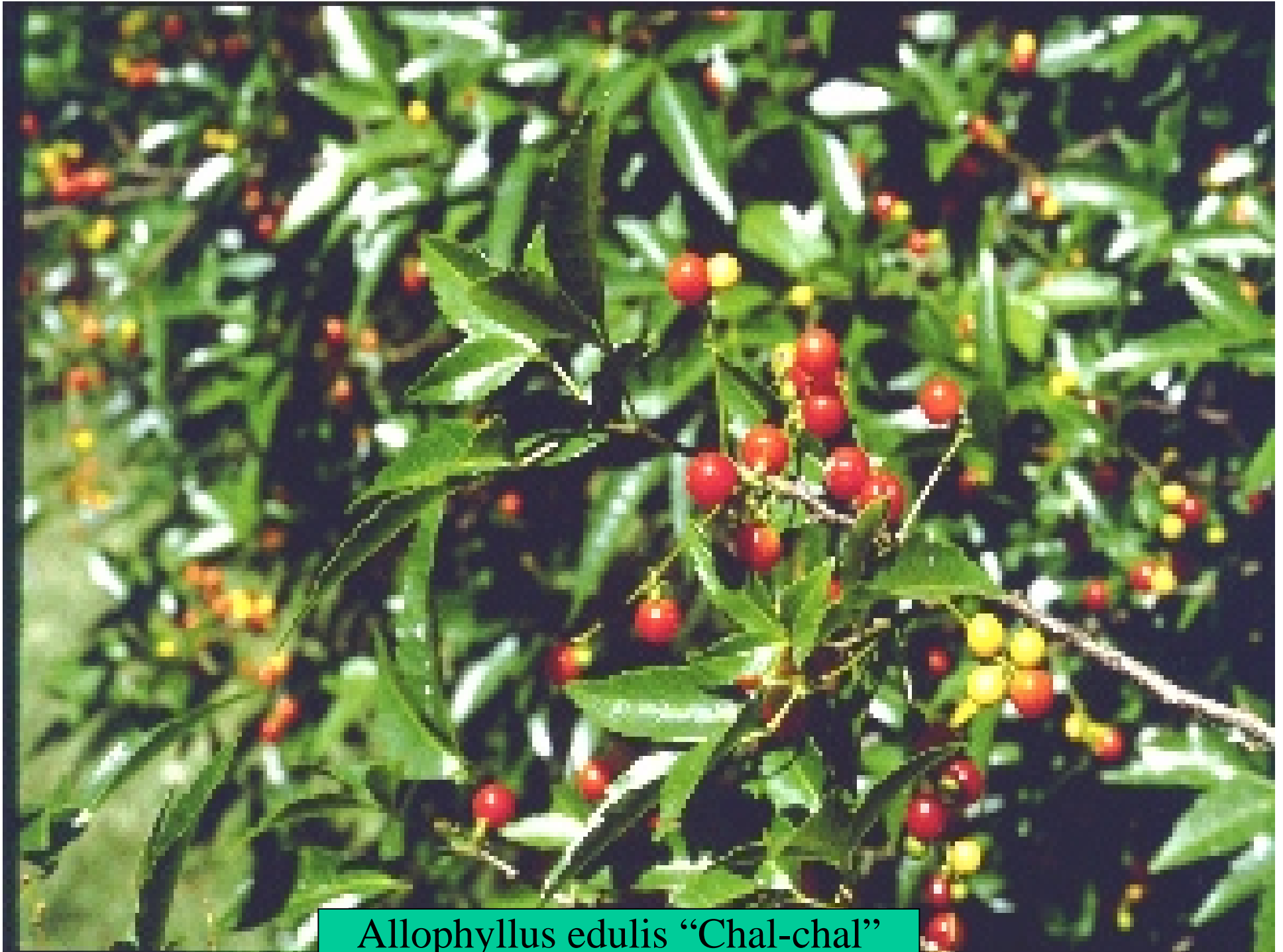
Allophyllus edulis "Chal-chal"