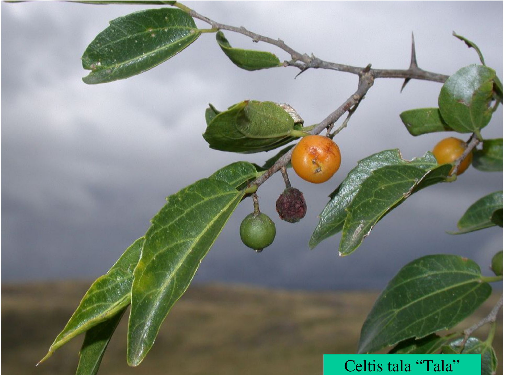
Celtis tala “Tala”