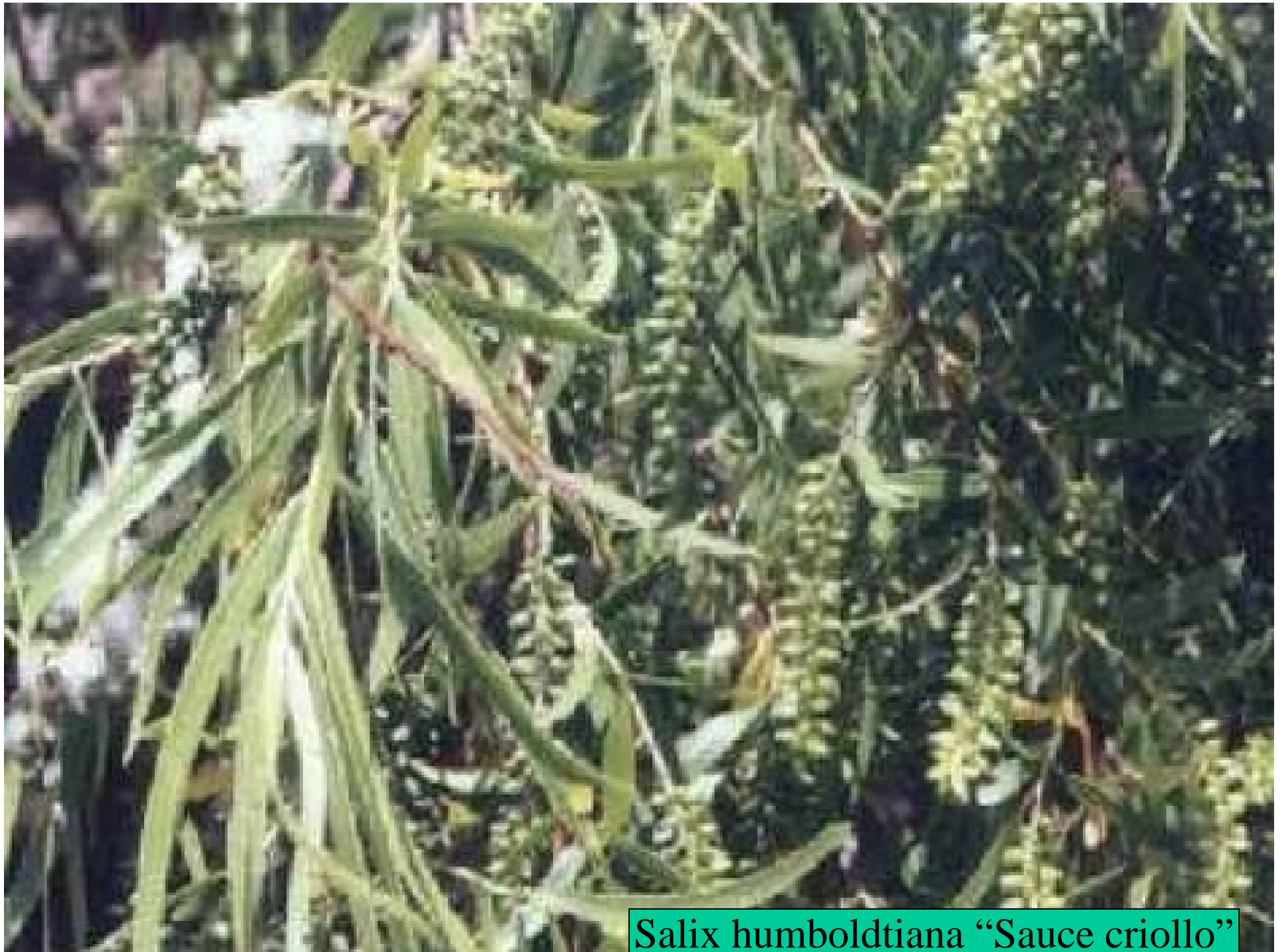
Salix humboldtiana "Sauce criollo"