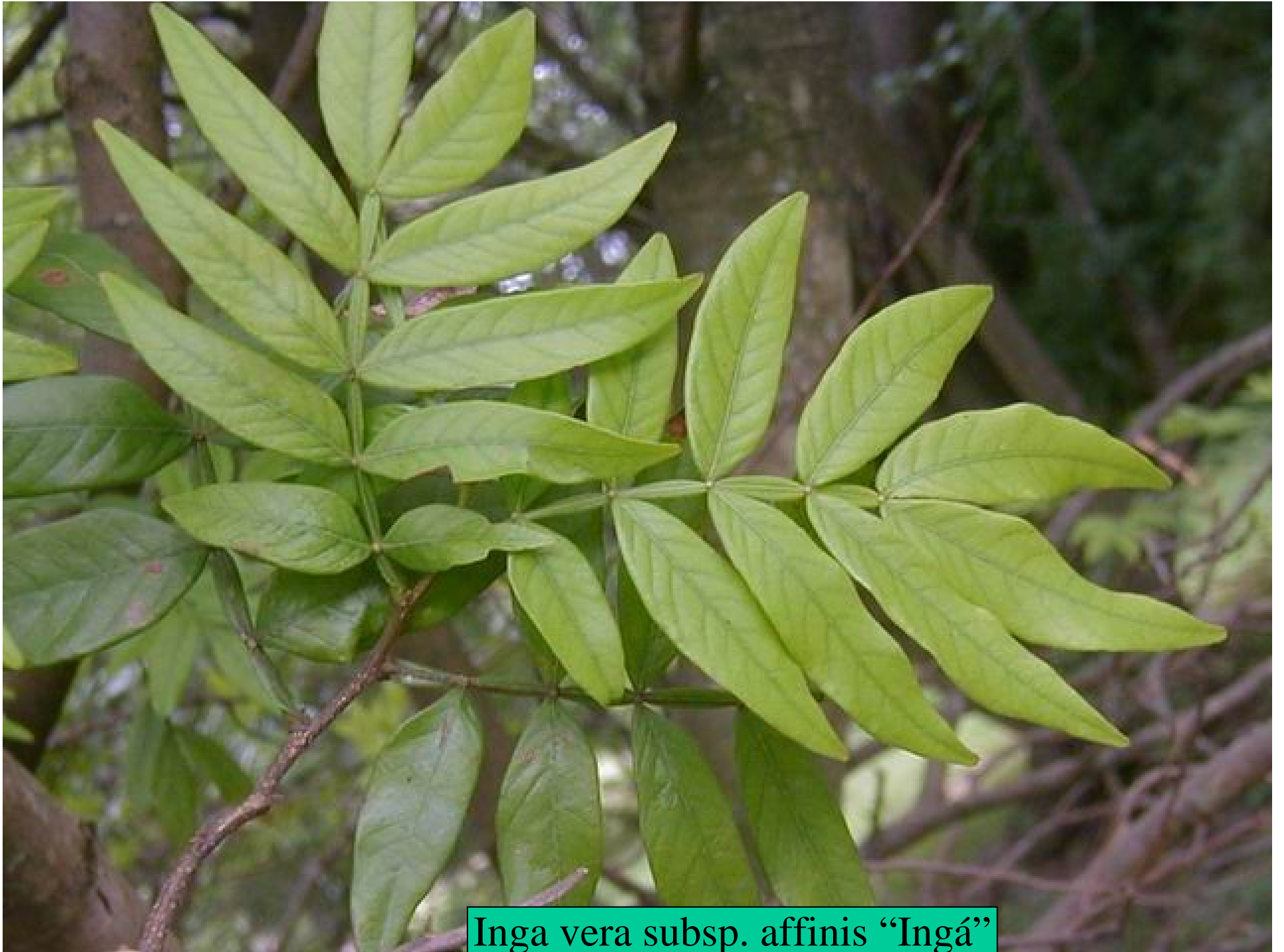
Inga vera subsp. affinis "Ingá"