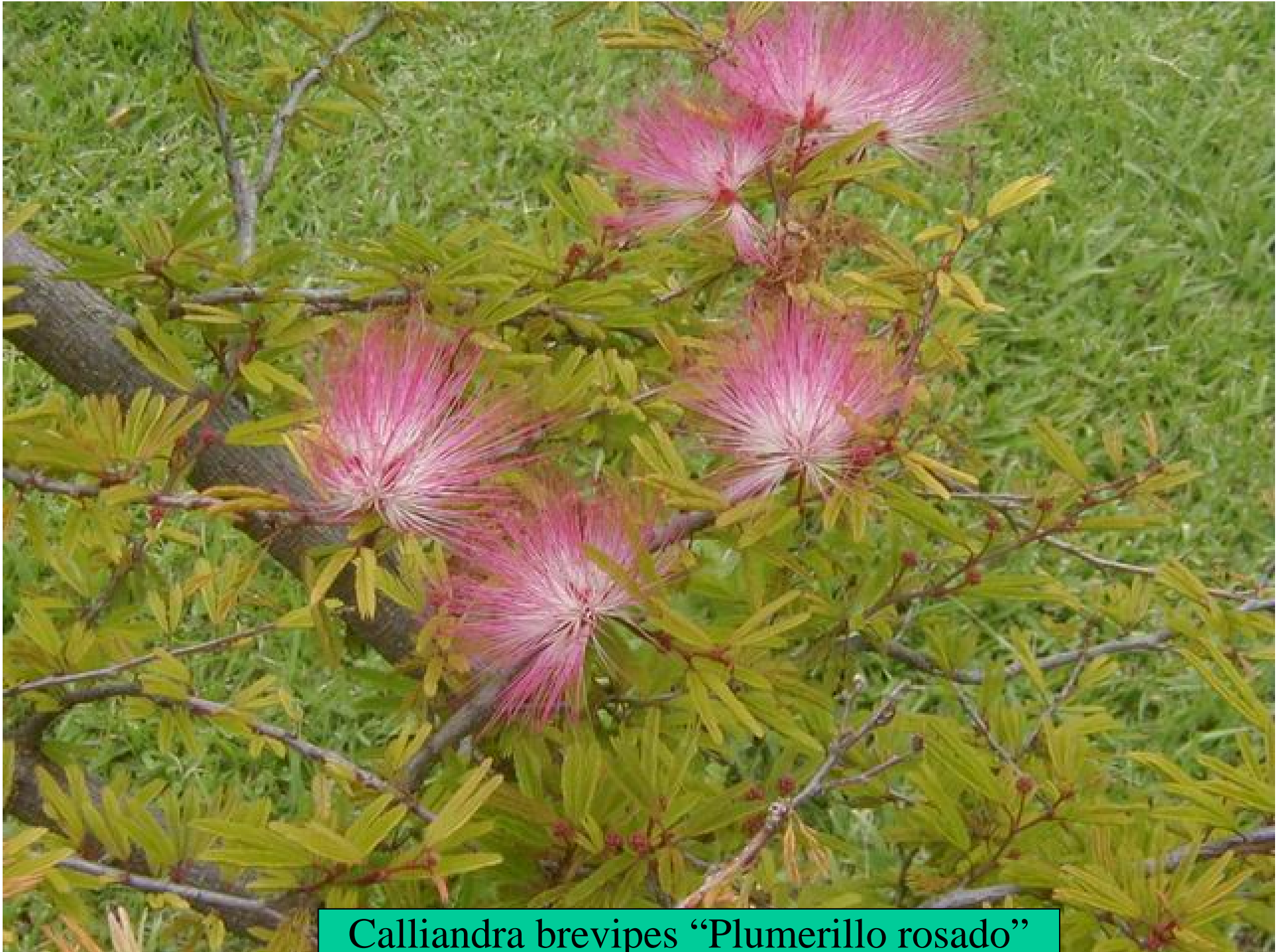
Calliandra brevipes "Plumerillo rosado"