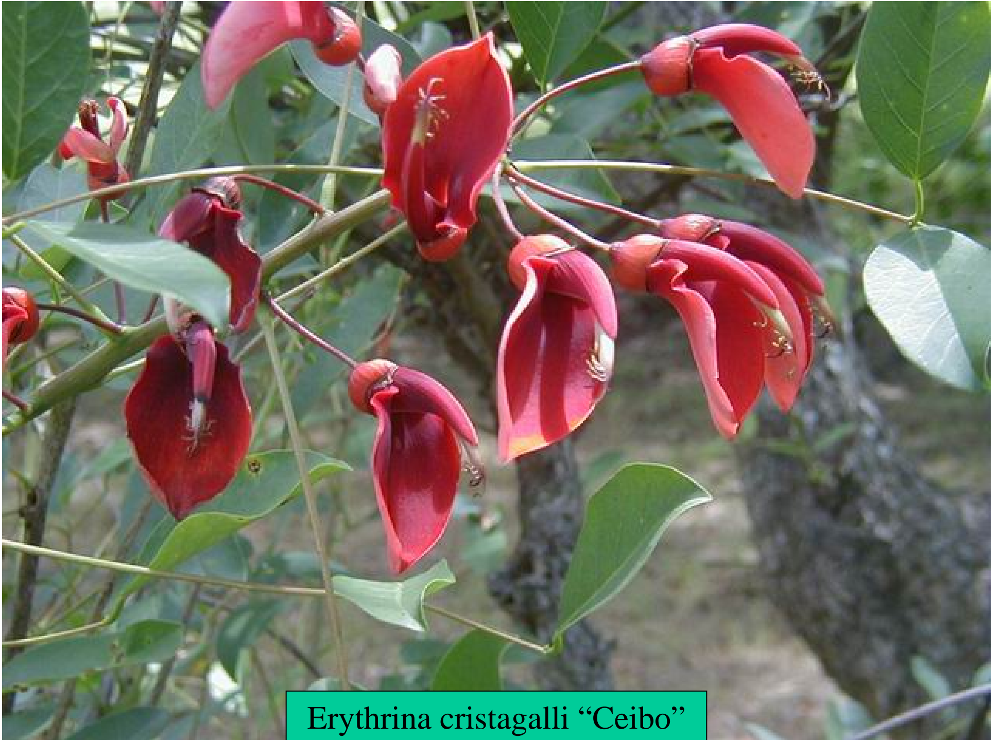
Erythrina cristagalli "Ceibo"