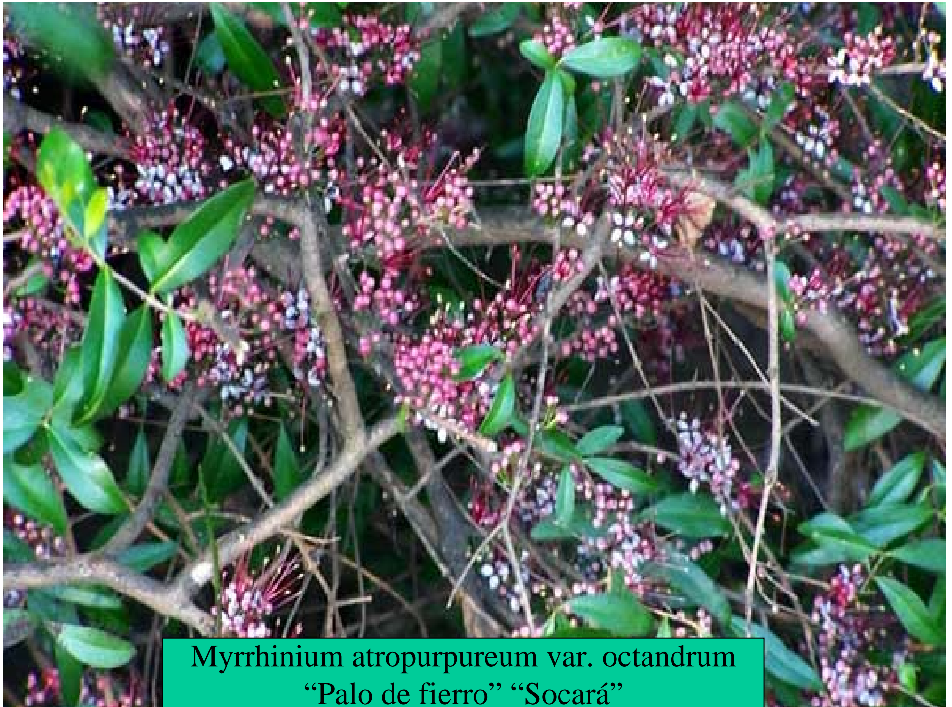
Myrrhinium atropurpureum var. octandrum “Palo de fierro” “Socará”