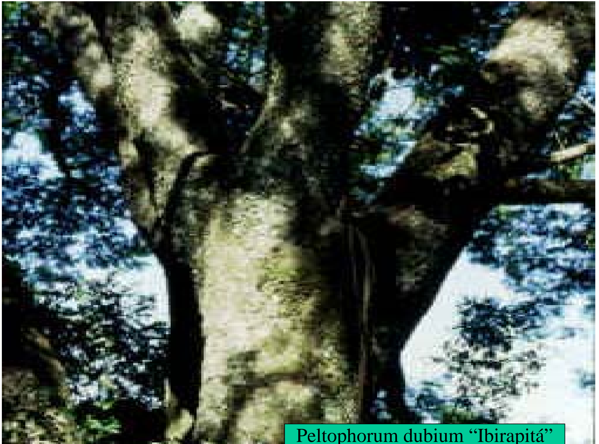
Peltophorum dubium "Ibirapitá"