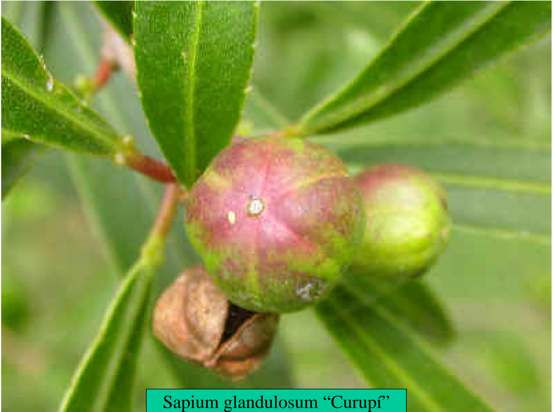
Sapium glandulosum “Curupí”