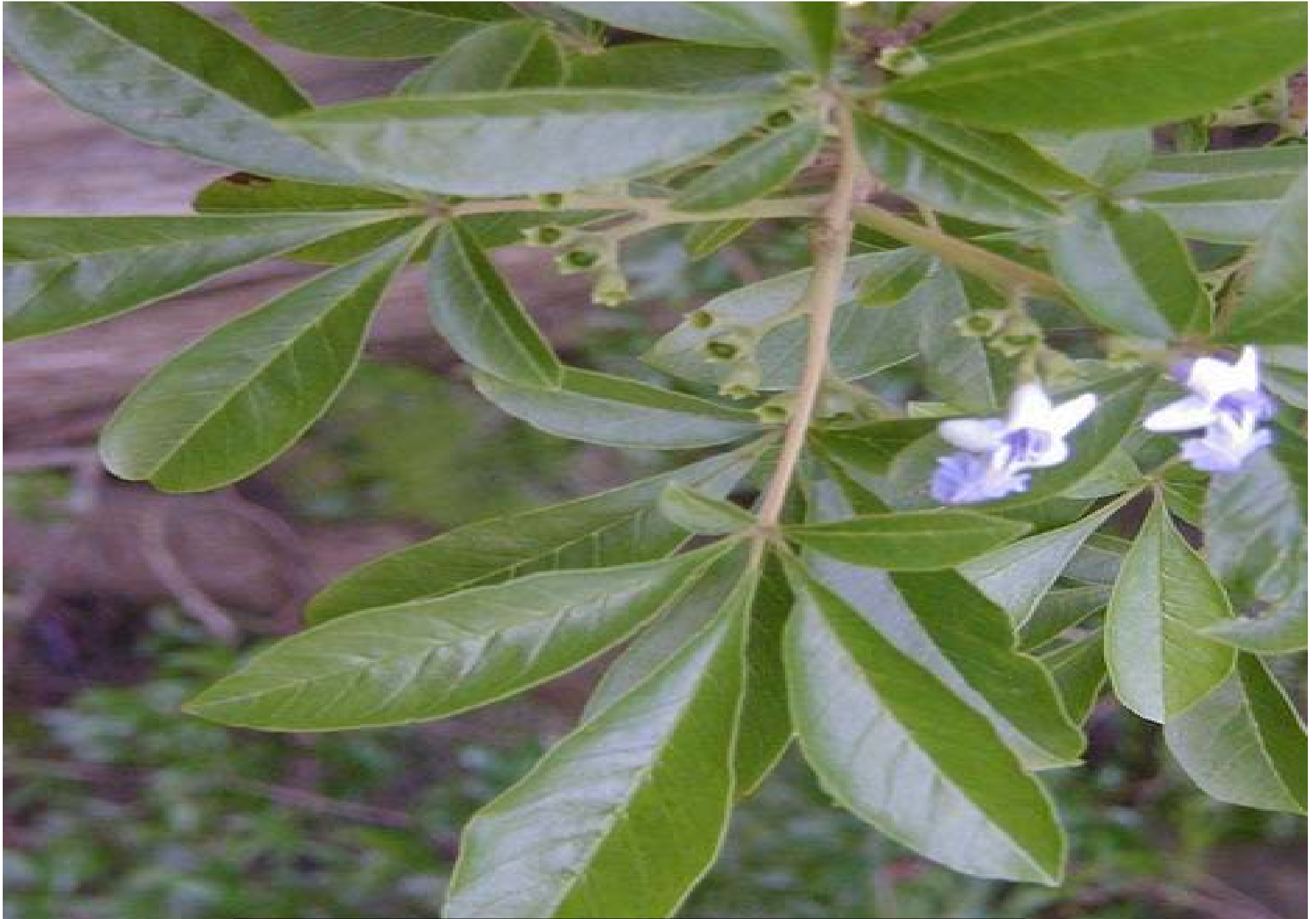
Vitex megapotamica “Tarumán sin espinas”