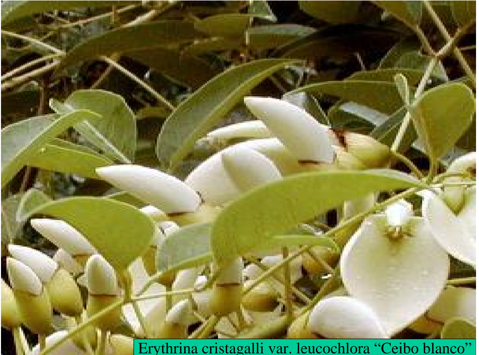
Erythrina cristagalli var. leucochlora "Ceibo blanco"