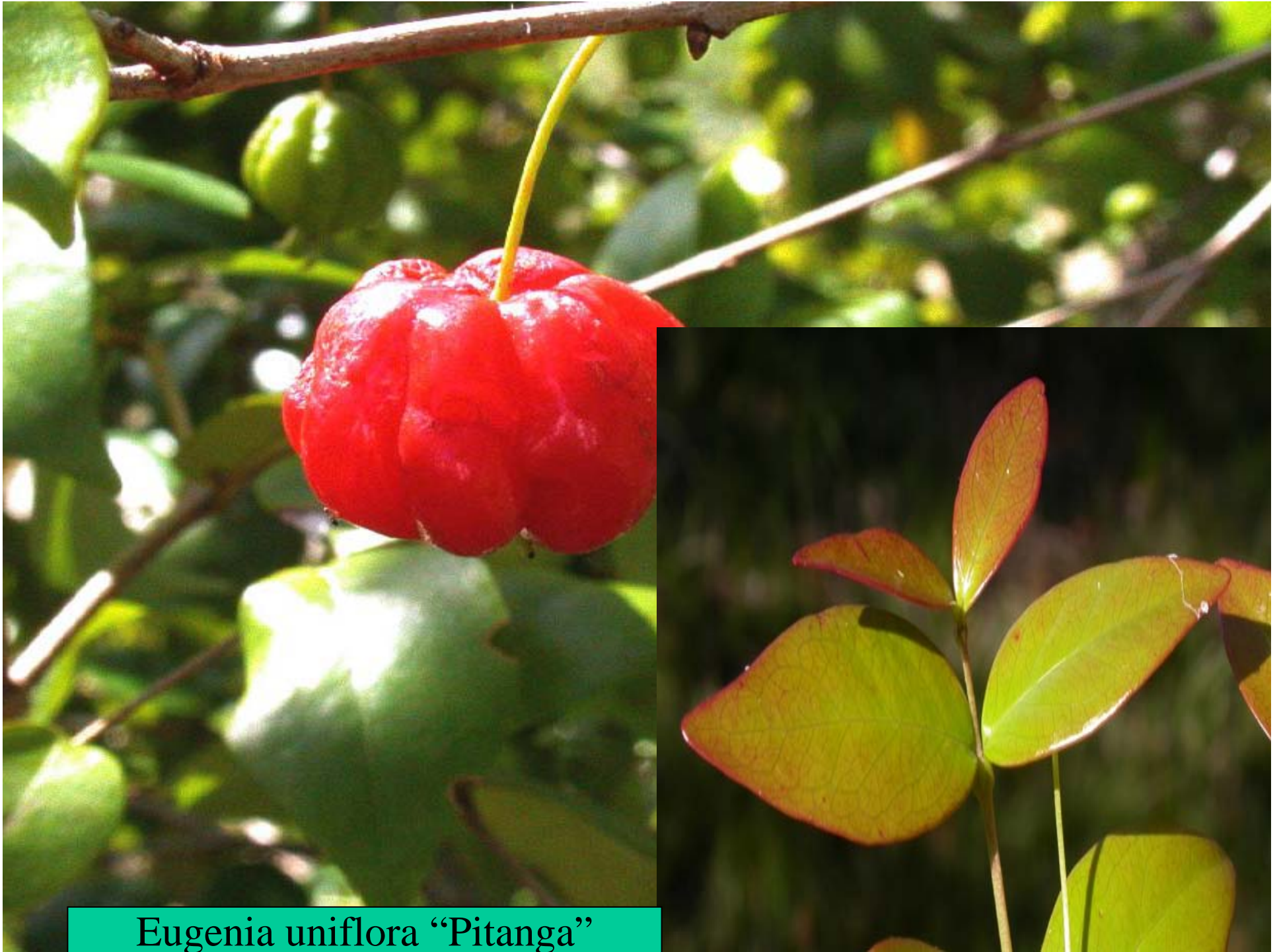
Eugenia uniflora “Pitanga”