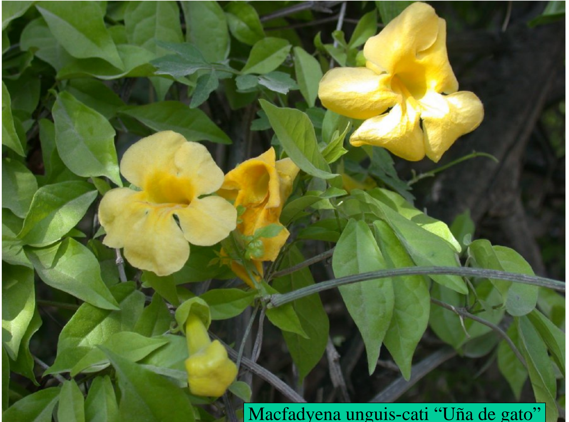
Macfadyena unguis-cati “Uña de gato”