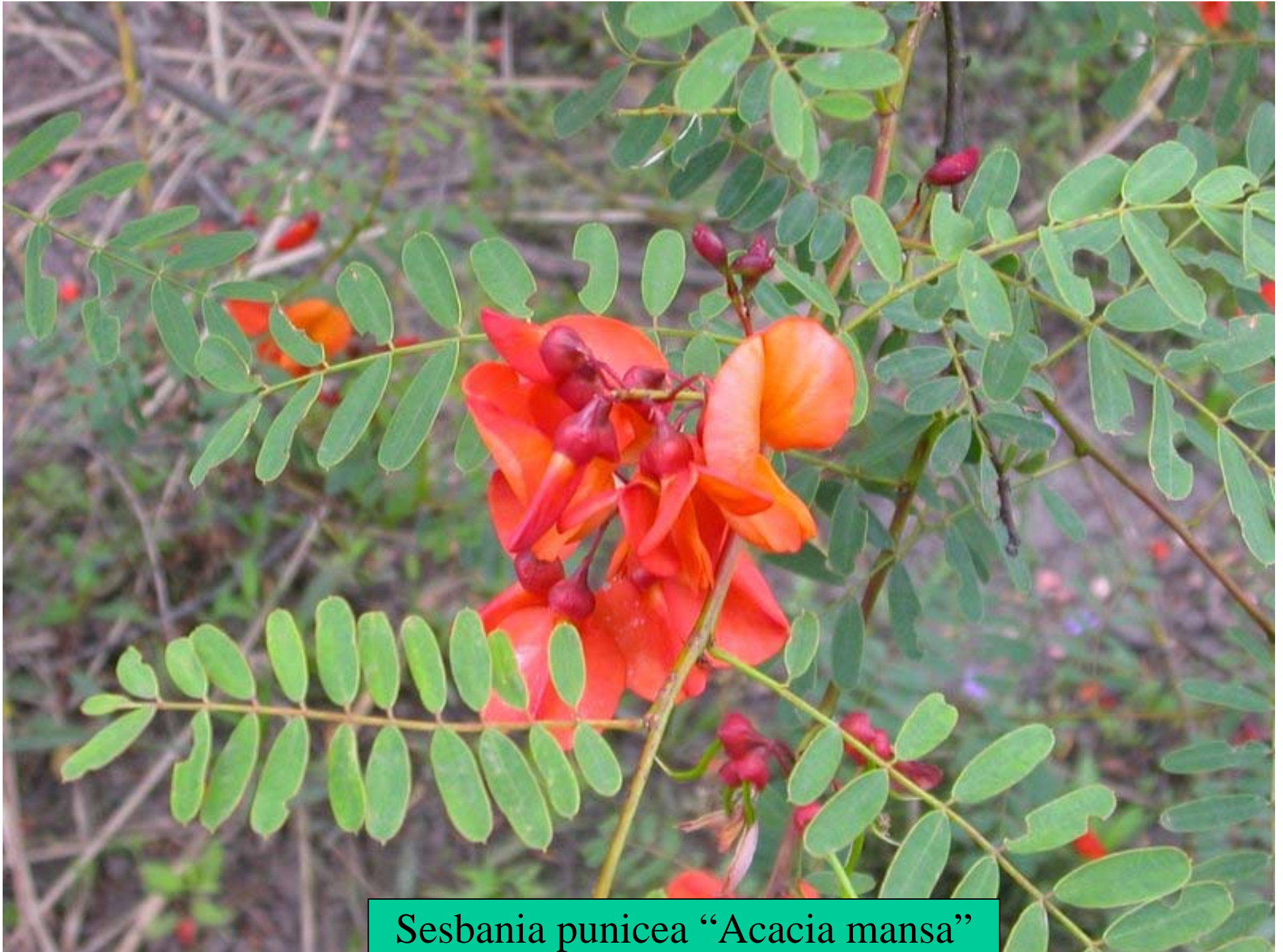
Sesbania punicea “Acacia mansa”