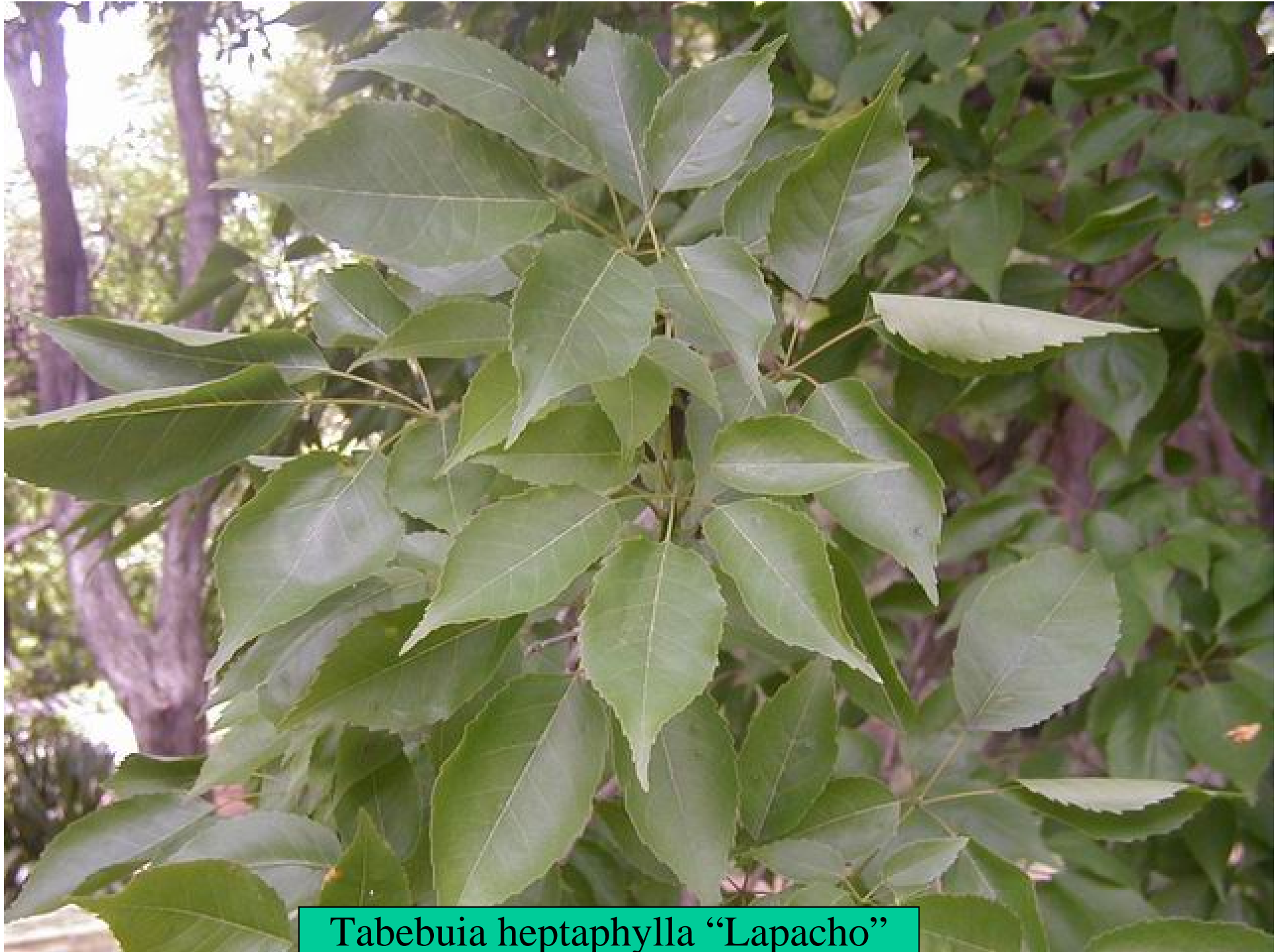
Tabebuia heptaphylla "Lapacho"