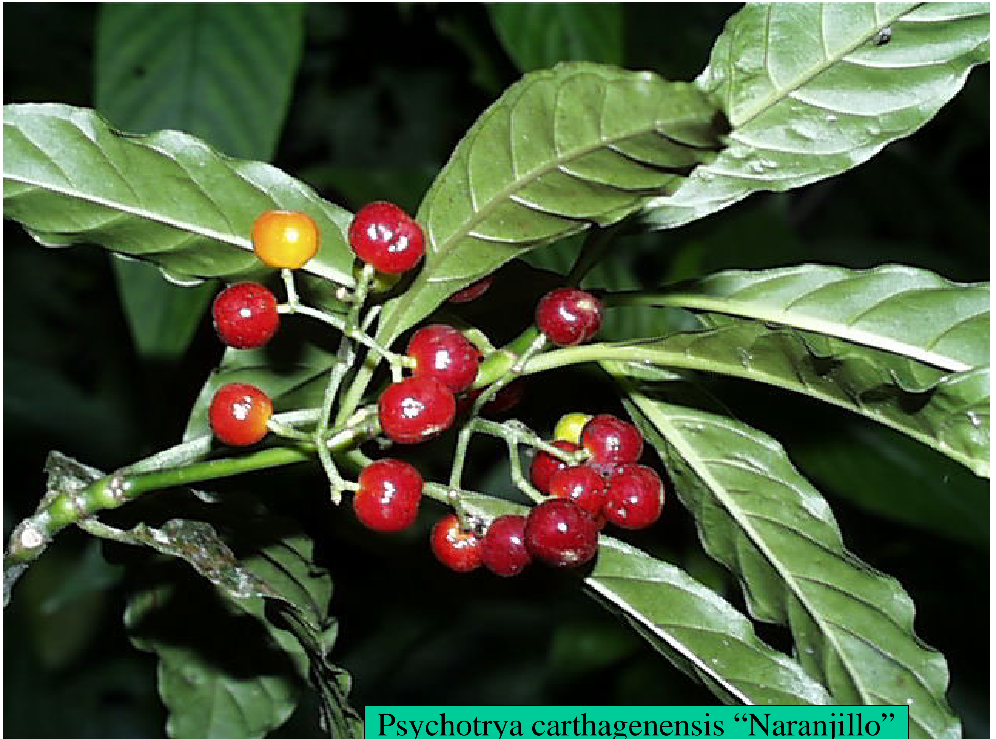
Psychotrya carthagenensis "Naranjillo"