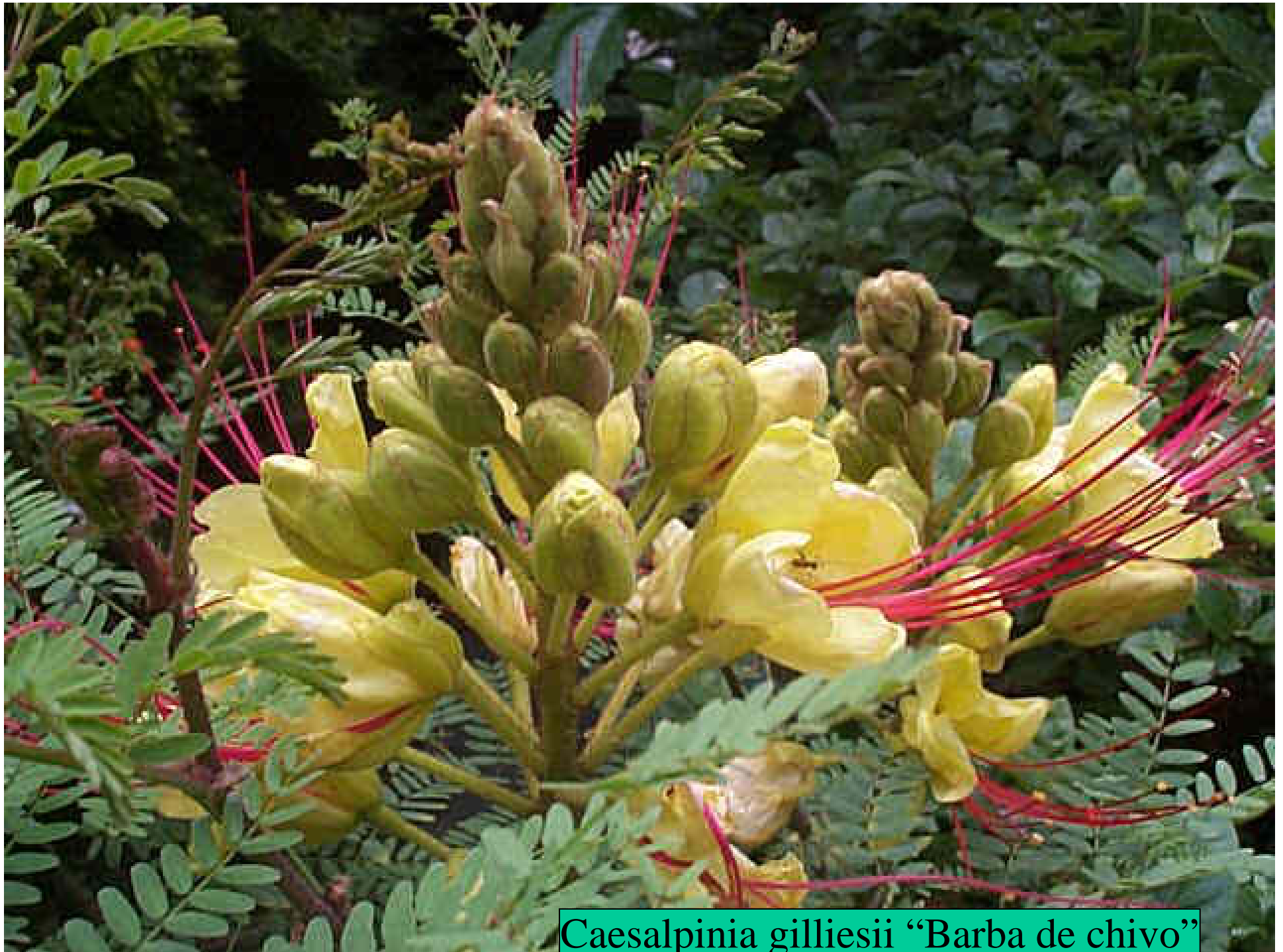
Caesalpinia gilliesii "Barba de chivo"